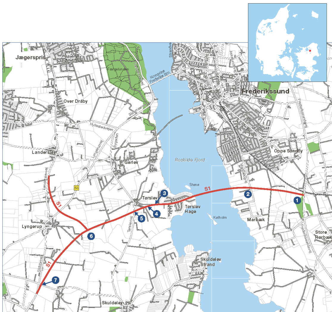
Figur 1 Foreslået placering af anlæg til ny fjordforbindelse ved Frederikssund